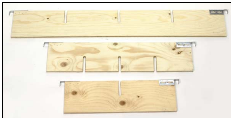
PE 2 and PE 3 för halvpall

280 mm mellan spåren på PE 1 och 180 mm på PE 2.