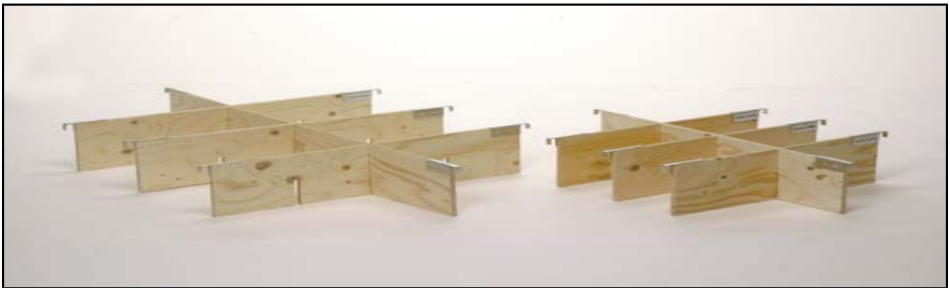
PE 1 och PE 2 för hel pall

I fortsättningen slipper Ni halvfulla pallar.